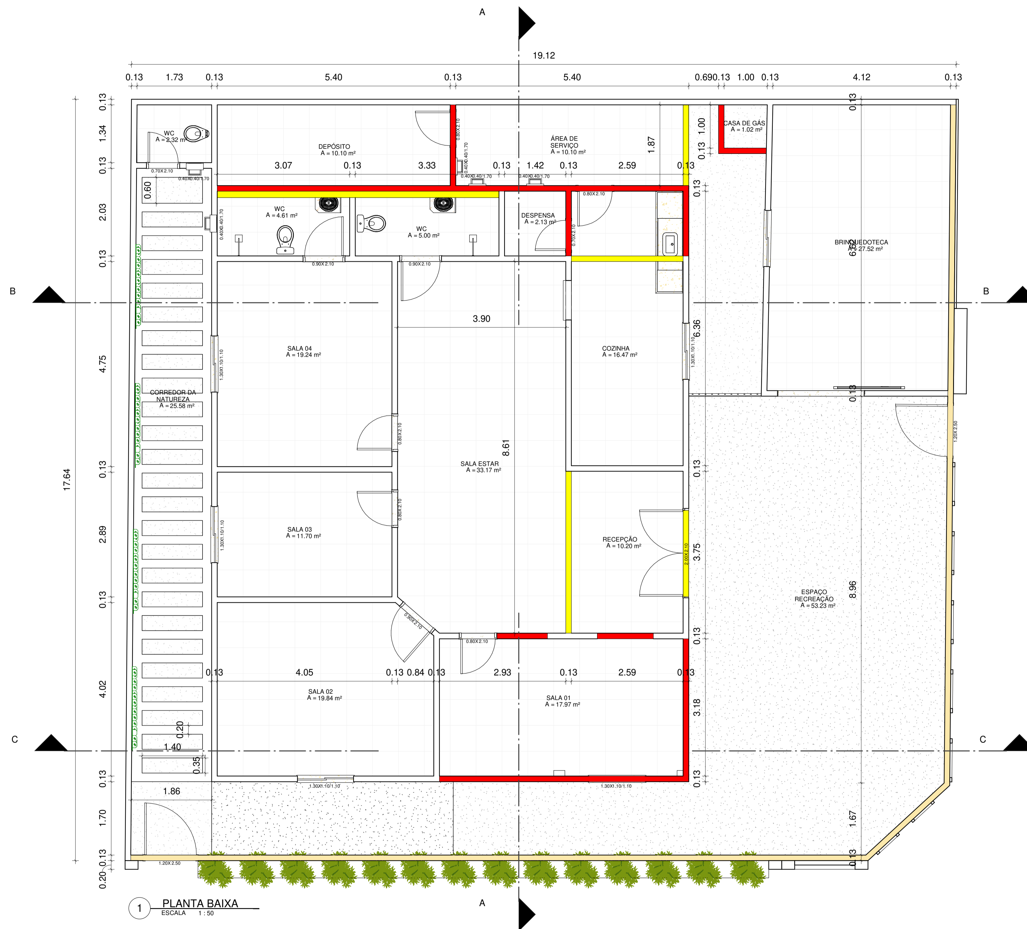
1 PLANTA BAIXA ESCALA 1:50