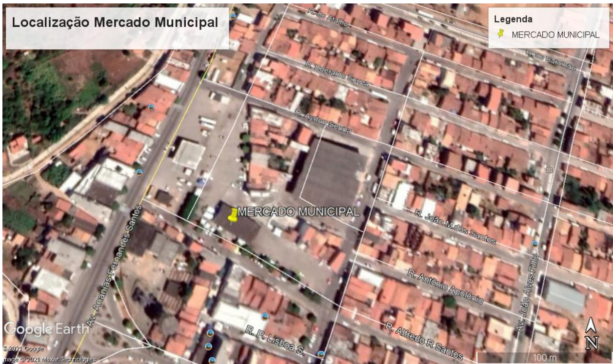
Figura 1: Planta de Localização.

A área conta com: poucas espécies arbustivas, delimitação com meio fio existente.