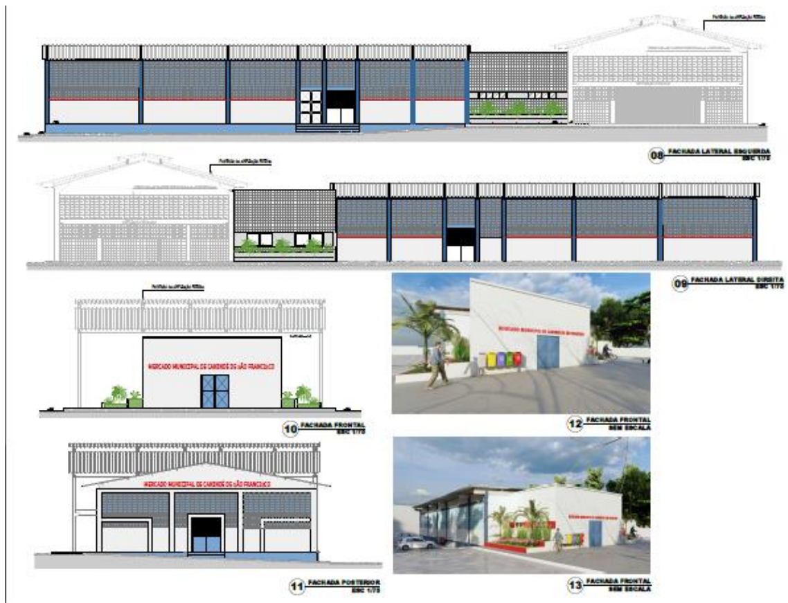
Figura 2: Fachadas e Cortes.