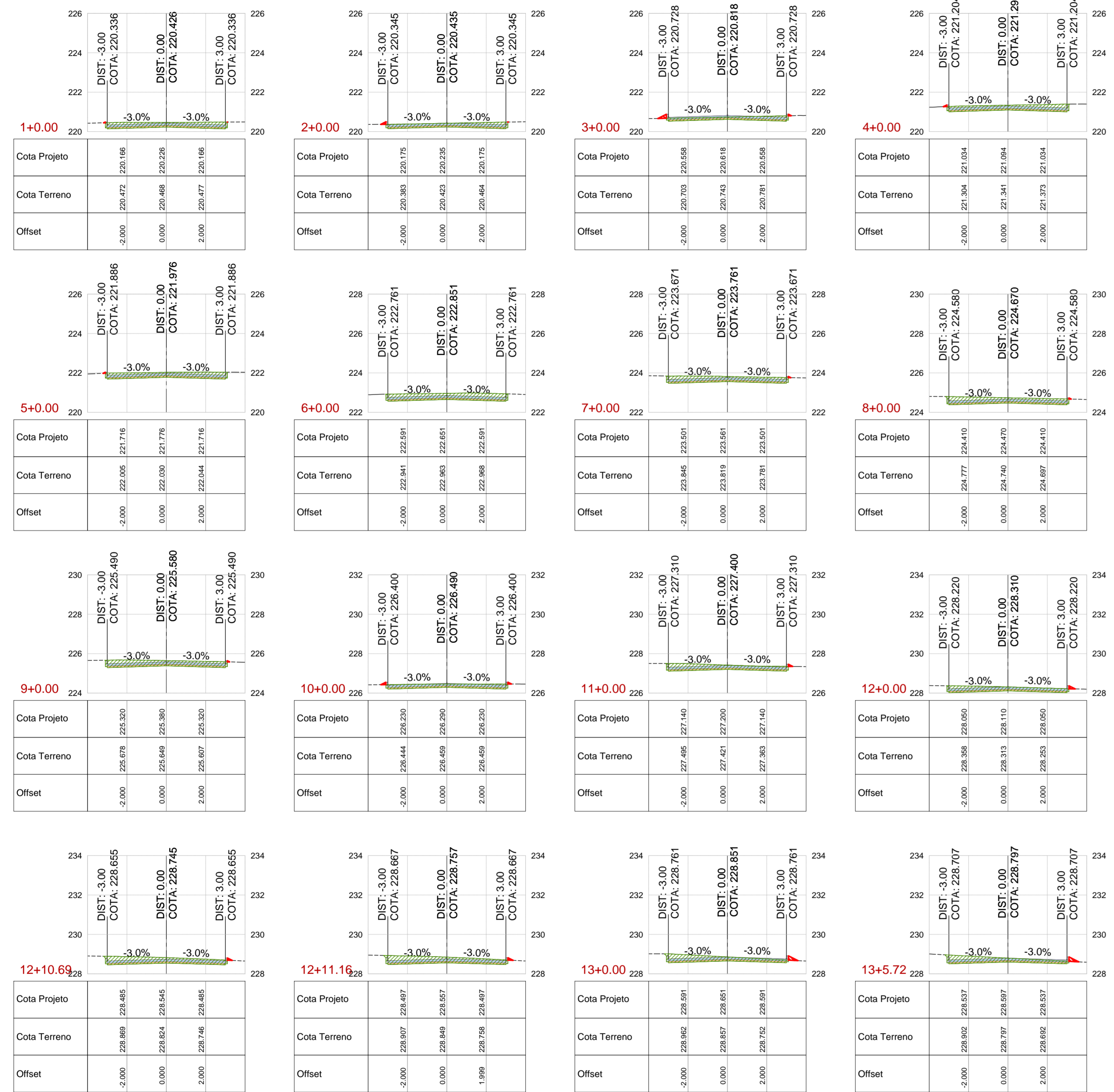
SESSÕES TRANSVERSAIS RUA 05 TRECHO 01 ESCALA /150